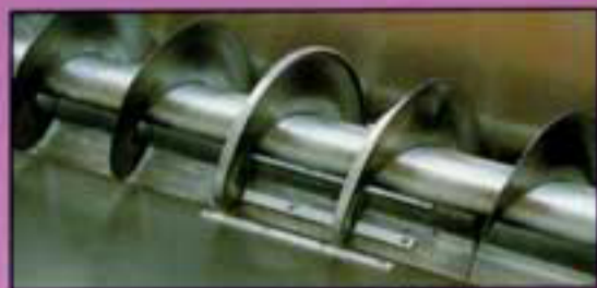
Coclea senza supporto intermedio Screw feeder without intermediate support Vis sans fin sans support intermédiaire