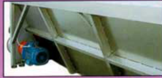
Pareti rinforzate Reinforced walls Parois renforcées