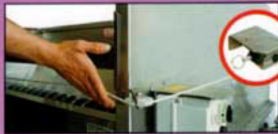
Dispositivo di sicurezza Safety device Dispositif de sécurité